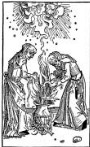
Abbildung Wetterzauber durch zwei Hexen

Historiker suchen heute noch nach Gründen, wie es zu den Hexenverfolgungen kommen konnte. Fest steht, dass im 16. und 17. Jahrhundert in Deutschland und Europa ein geistiges Klima herrschte, das die Verfolgungen begünstigte. Kriege, Krankheiten und Katastrophen erzeugten bei den Menschen Angst und Panik. Es herrschte Endzeitstimmung. Um 1590 wüteten die spanischen Truppen in Deutschland. Eine Pestepidemie raffte zum Teil die Hälfte der Bevölkerung hinweg. Überall in Mitteleuropa sanken die Temperaturen - die sogenannte kleine Eiszeit. Die Ernten verdarben, die Menschen litten Hunger, das Vieh starb. Krankheiten breiteten sich aus.