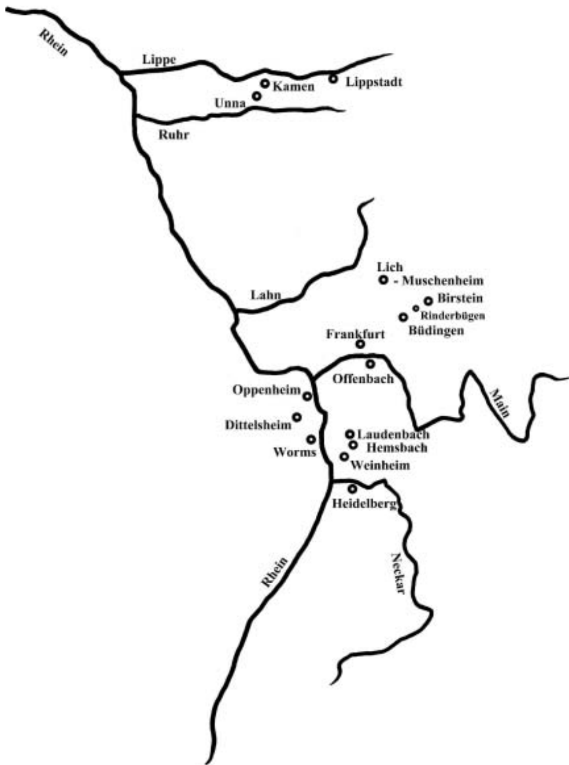
Abbildung Karte der Lebensstationen von Praetorius