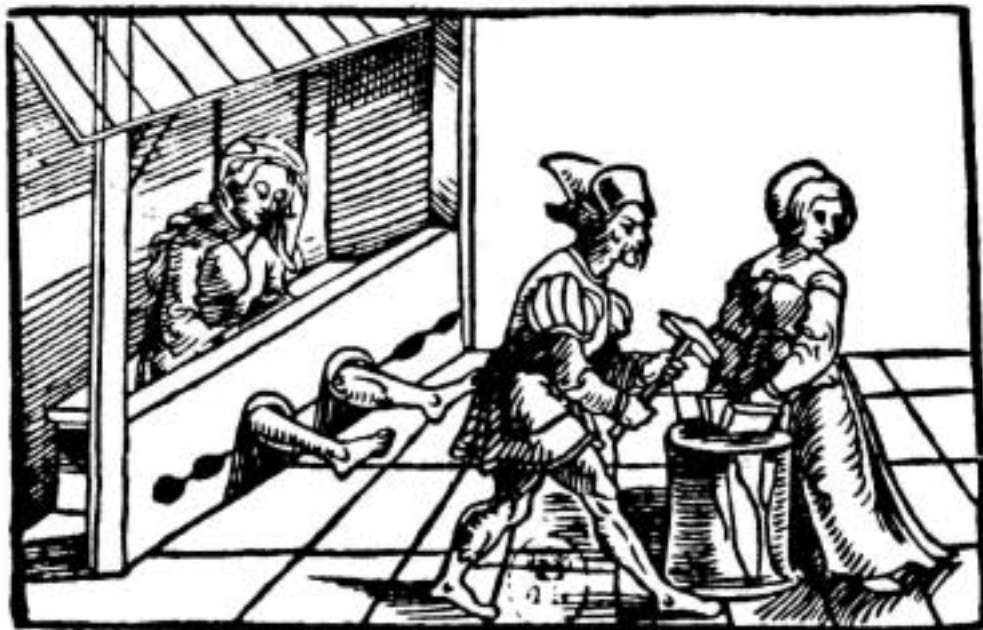
Folter und Pranger