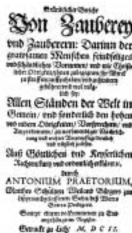
Abbildung Titelseite von Praetorius Bericht von 1602

Will heißen: Der Pfarrer wettet derart gegen die Folter, dass der Prozess beendet und die noch lebende Gefangene freigelassen wird. Dies ist der einzig überlieferte Fall, dass ein Geistlicher während eines Hexenprozesses offen die Beendigung der unmenschlichen Folterungen verlangt - und Erfolg hat. Leider stirbt die Frau wenige Tage danach an den Folgen der Torturen. Der Graf ist über das Auftreten seines Hofpredigers außer sich, aber Anton Praetorius kommt mit dem Leben davon. Er fällt in Ungnade und wird entlassen. Schließlich findet er in der Nähe von Heidelberg im reformierten Dorf Laudenbach eine neue Pfarrstelle. Dort schreibt er zunächst unter einem Pseudonym und dann 1602 unter seinem eigenen Namen ein engagiertes Buch gegen die unchristlichen Hexenprozesse: "Gründlicher Bericht über Zauberey und Zauberer". Er ist Christ, und seine alleinige Richtschnur ist die Bibel. Nach diesem Maßstab "sola scriptura" legt er dar, dass die lange Haft und Folter von Unschuldigen dem Geist und dem Buchstaben des Evangeliums widerspricht. Schonungslos attackiert er in seiner schlichten, bibelfesten Frömmigkeit Hexenrichter und ihre Obrigkeiten: " Oder denket ihr Menschenkinder, die ihr richtet, daß ihr dem Urteil Gottes entrinnen werdet? - O nein, o nein, liebe Herren, das wird euch nicht durchgehen... " Die Fürsten bekommen zu hören: " Liebe Herren, wie lange soll die Ehre Gottes unter euch also geschändet werden? "